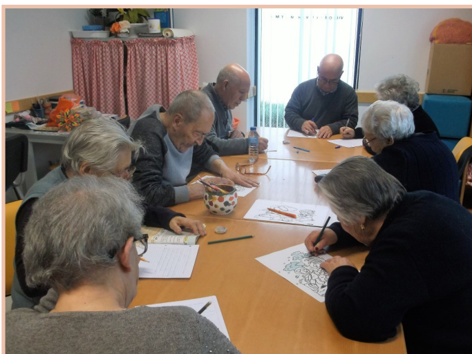
Atividade de pintura