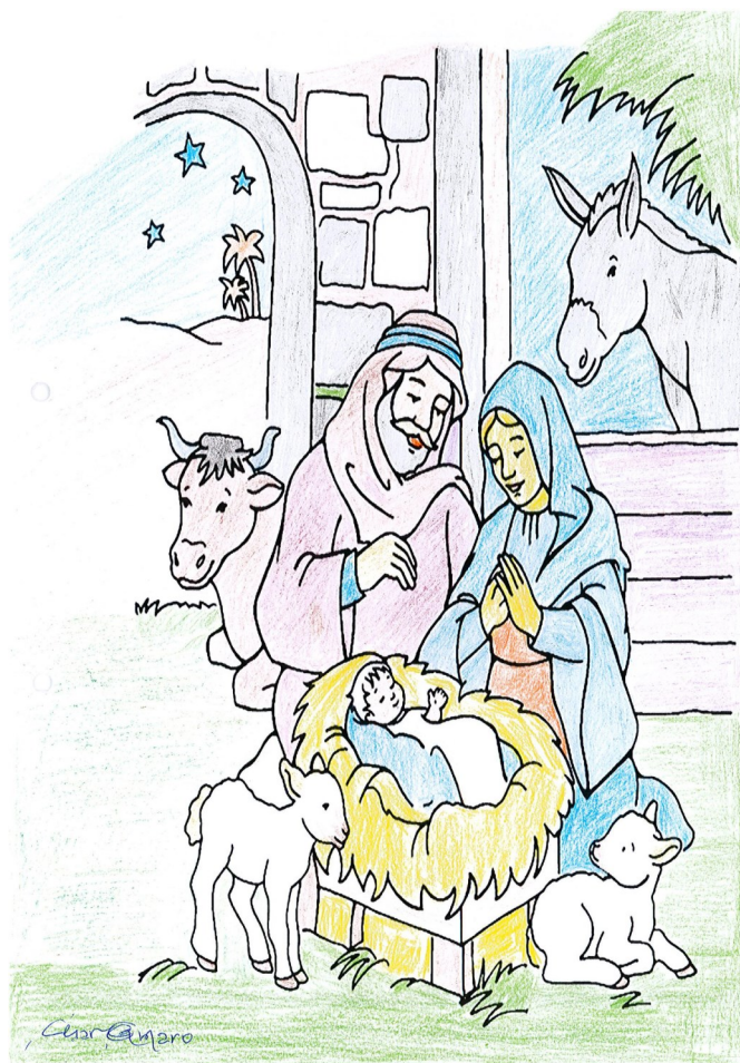
Trabalho realizado por utente de SAD