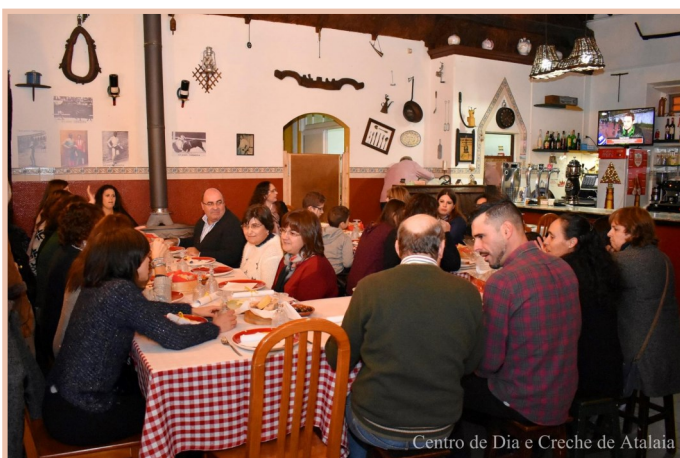
Jantar de Natal